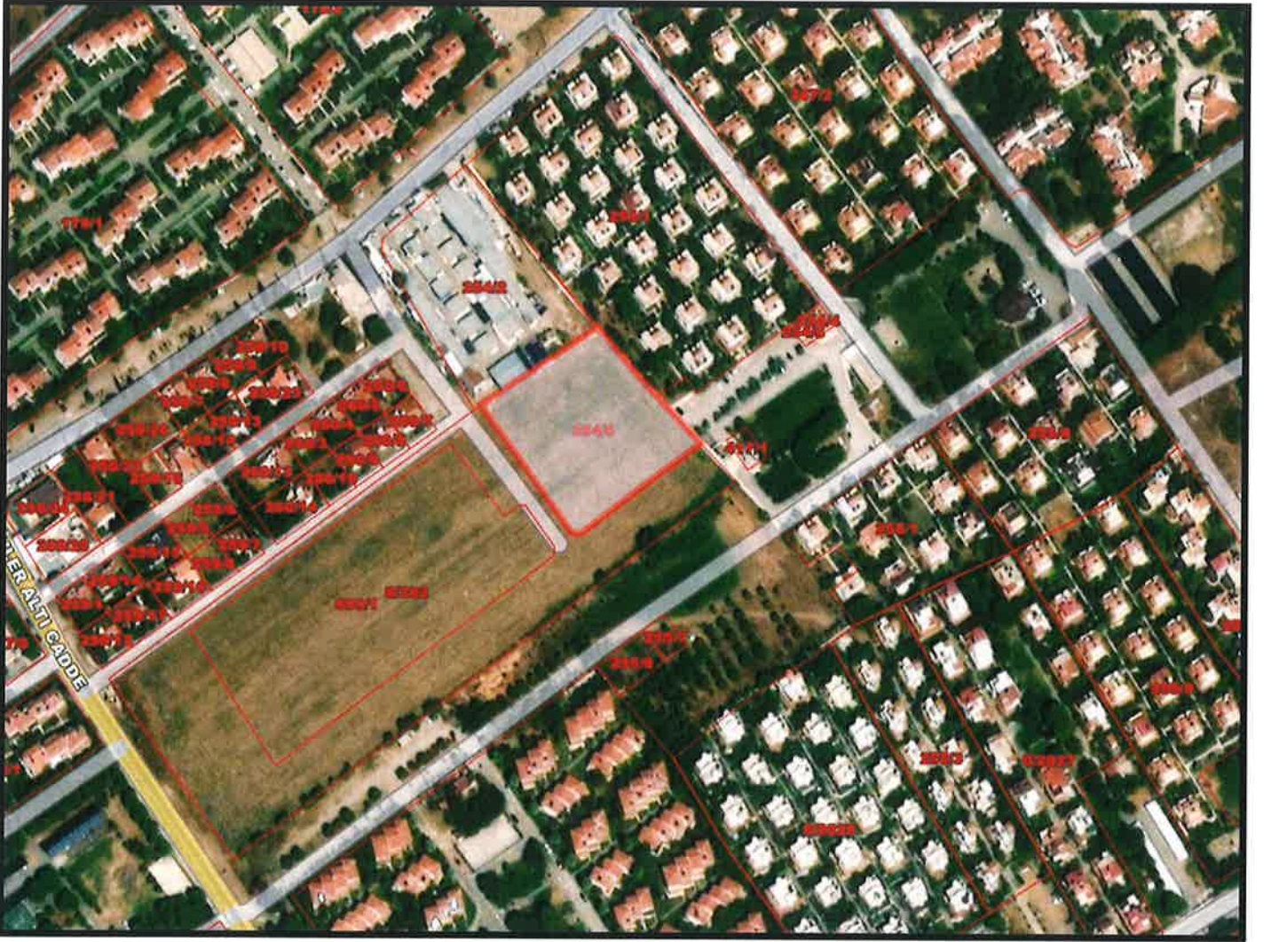
Resim 1: 254 ada 6 parsel ve çevresini gösterir uydu fotoğrafı

Planlama alanı, İzmir ili, Dikili ilçesi, Salihler Mahallesi sınırları içerisinde yer almakta olup, 5.098 m 2 alana sahip, 254 ada 6 parseli kapsamaktadır. Söz konusu parsel, ikinci konut alanlarının yoğun olarak bulunduğu, özellikle yaz aylarında nüfus yoğunluğunun önemli ölçüde arttığı bir bölgede yer almaktadır.